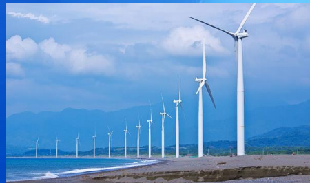
基礎建設開發及建造