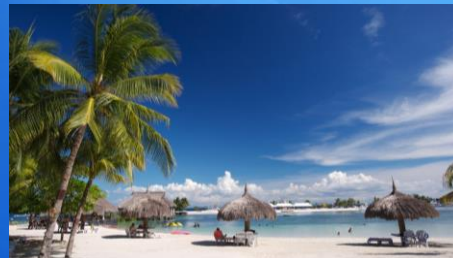
觀光及礎建設投資