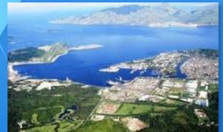
自由港及經濟特區

馬尼拉經濟文化辦事處誠摯邀請台灣商界領袖和投資廠商參加此次菲律賓招商說明會，主題是菲律賓的投資機會 - 台灣經濟走廊及新台菲雙邊投資協定。